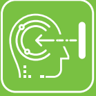
Proaktif Yüz Tanıma

Başlangıç Yüz Tanıma Terminali 5 inç Dokunmatik Ekranlı