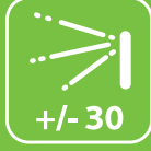
Geniş poz açısı