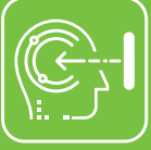
Proaktif Yüz Tanıma